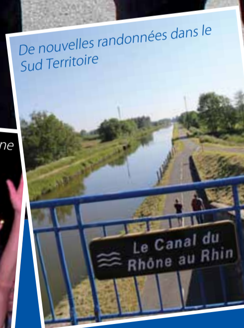
De nouvelles randonnées dans le Sud Territoire