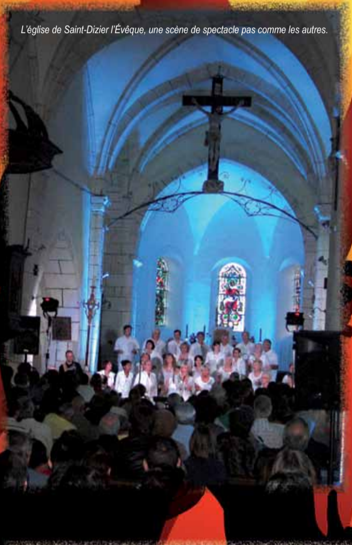
L'église de Saint-Dizier l'Évêque, une scène de spectacle pas comme les autres.