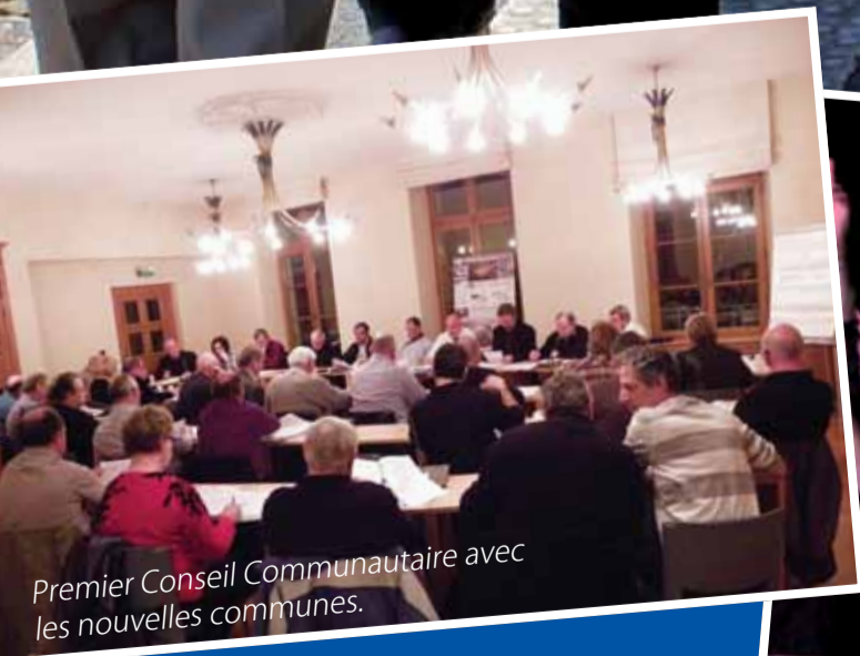
Premier Conseil Communautaire avec les nouvelles communes.