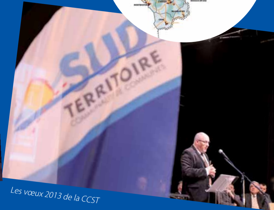
Les vœux 2013 de la CCST