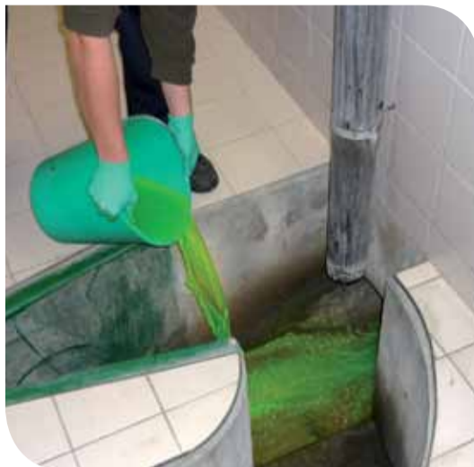
Coloration dans le réseau pour tracer les fuites (frontière franco-suisse)

Une étude de faisabilité a été réalisée en 2012-2013 pour définir les possibilités d'assainissement intercommunal de trois communes : Réchesy, qui possède une station d'épuration vétuste, Courtelevant et Florimont, qui ne