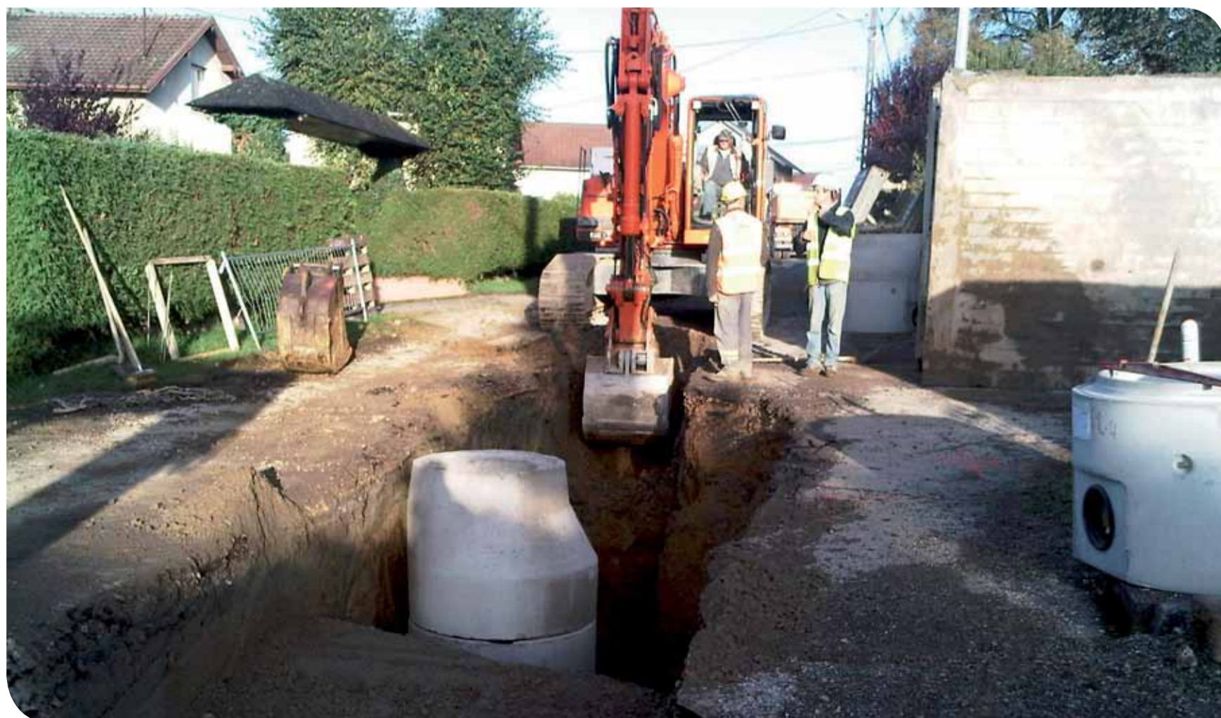
Travaux d'assainissement sur le réseau de la CCST.

L'assainissement est bien un des services «de base» que propose la CCST aux usagers du Sud Territoire. Nombre de ces opérations n'auraient pu voir le jour aussi promptement et efficacement si elles n'étaient le fruit d'un travail communautaire.