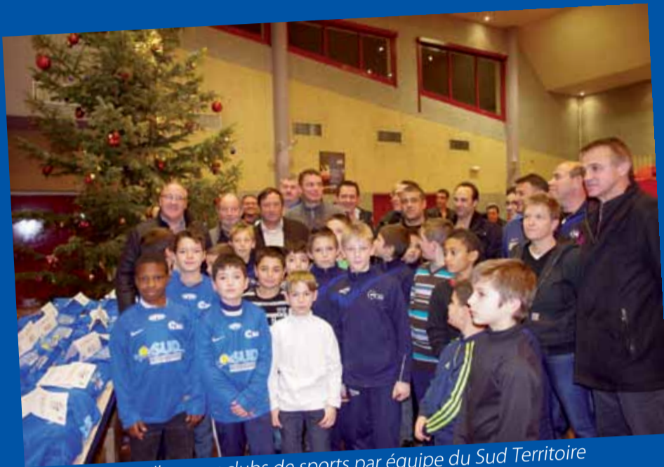
Remise des maillots aux clubs de sports par équipe du Sud Territoire (18 décembre 2012).