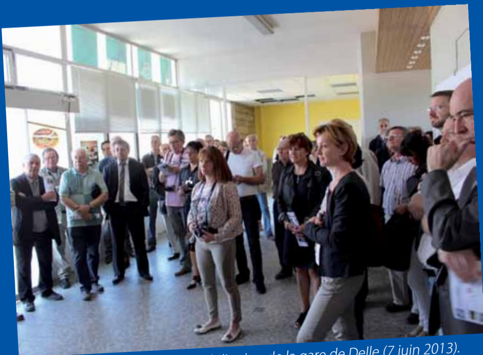
Lancement des travaux de réhabilitation de la gare de Delle (7 juin 2013).