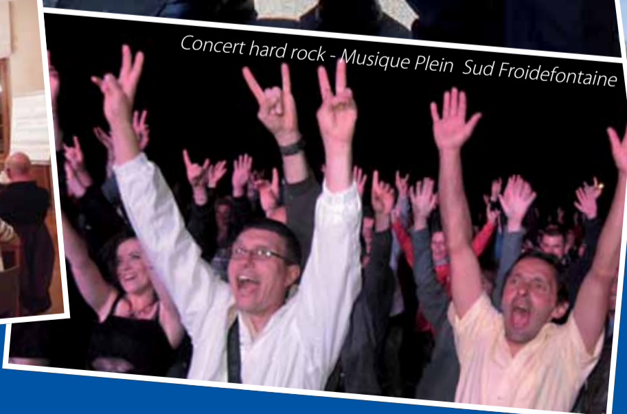
Concert hard rock - Musique Plein Sud Froidefontaine