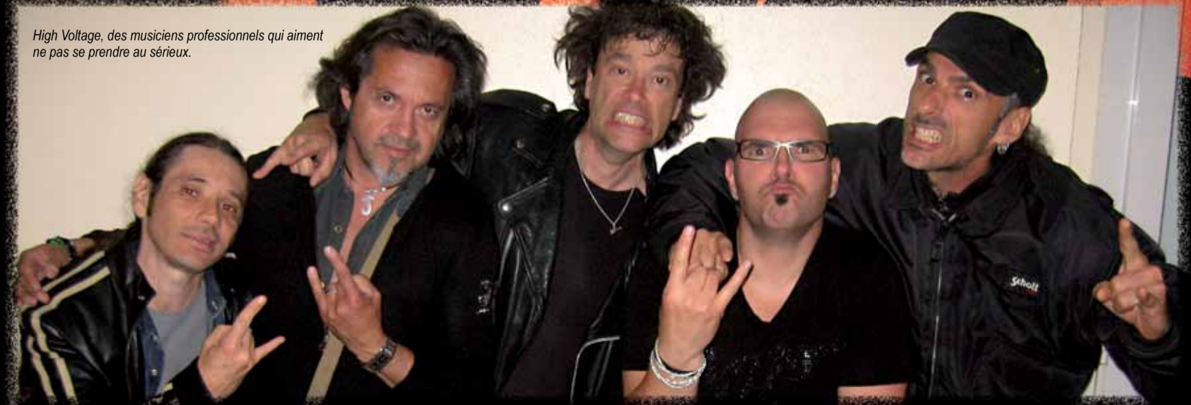
High Voltage, des musiciens professionnels qui aiment ne pas se prendre au sérieux.