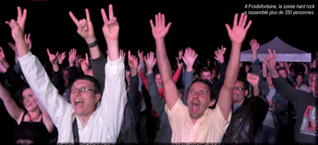
A Froidefontaine, la soirée hard rock a rassemblé plus de 350 personnes.