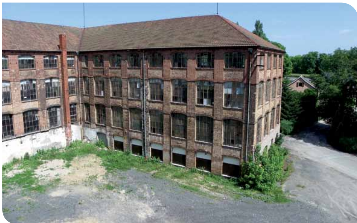
Le Fer à Cheval des Fonteneilles à Beaucourt