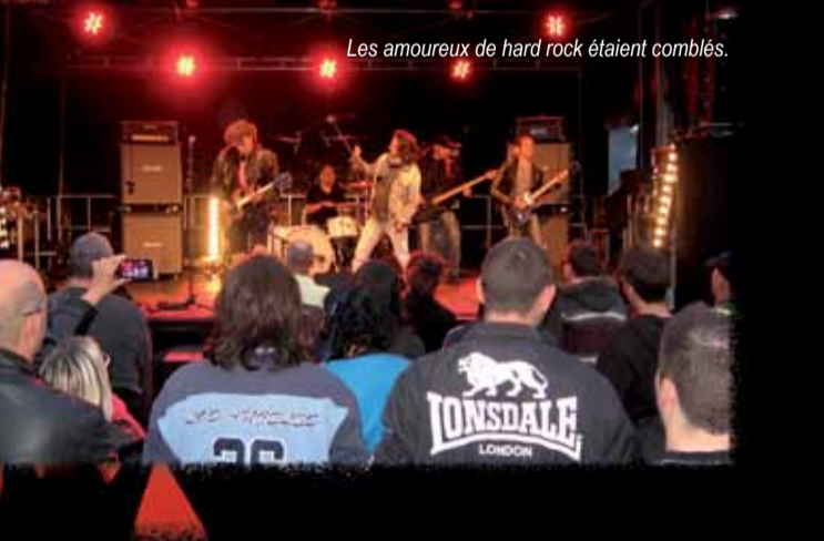
Les amoureux de hard rock étaient comblés.