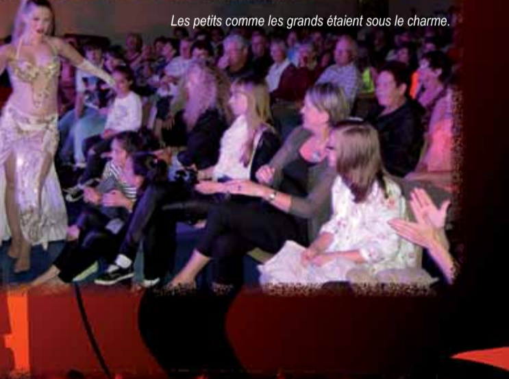
Les petits comme les grands étaient sous le charme.