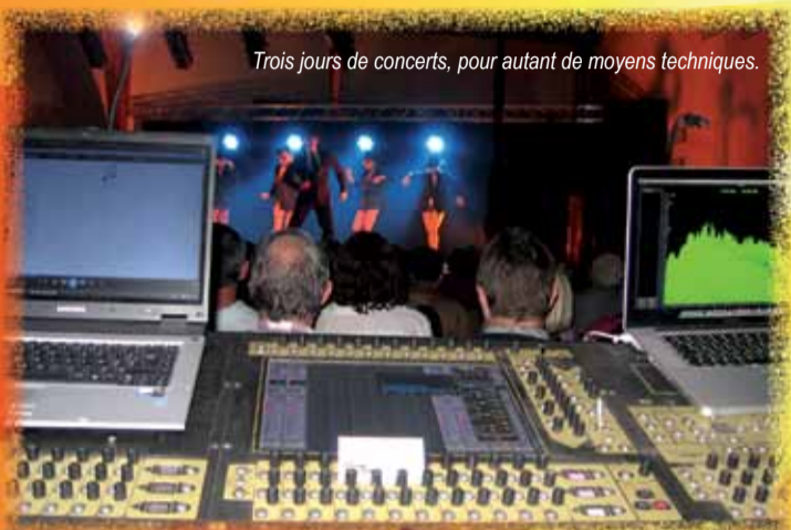
Trois jours de concerts, pour autant de moyens techniques.