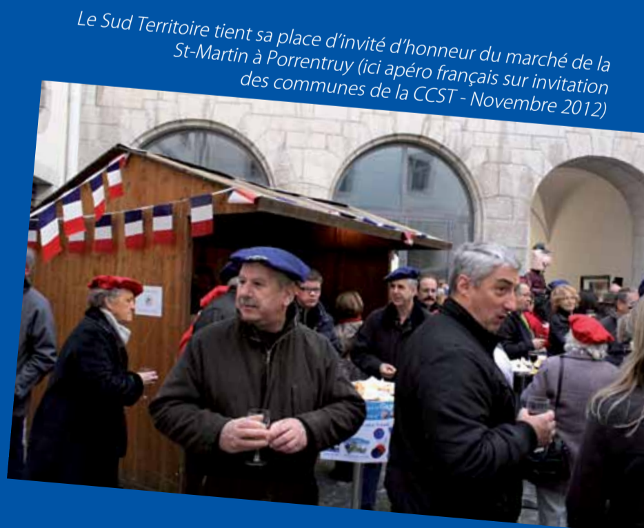
Le Sud Territoire tient sa place d'invité d'honneur du marché de la St-Martin à Porrentruy (ici apéro français sur invitation des communes de la CCST - Novembre 2012)