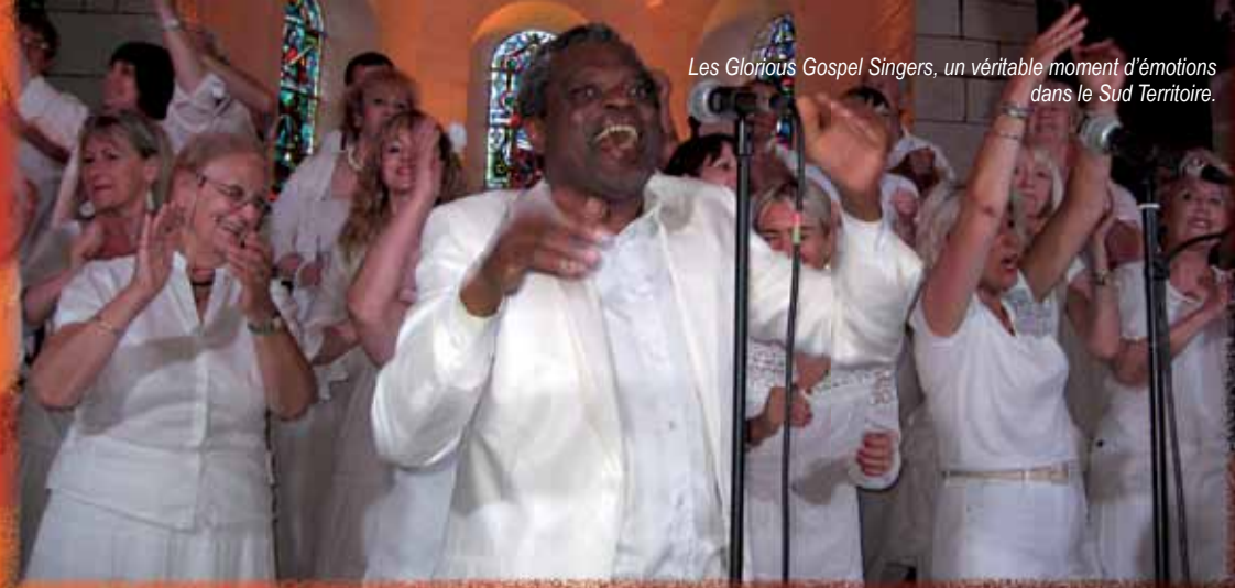
Les Glorious Gospel Singers, un véritable moment d'émotions dans le Sud Territoire.