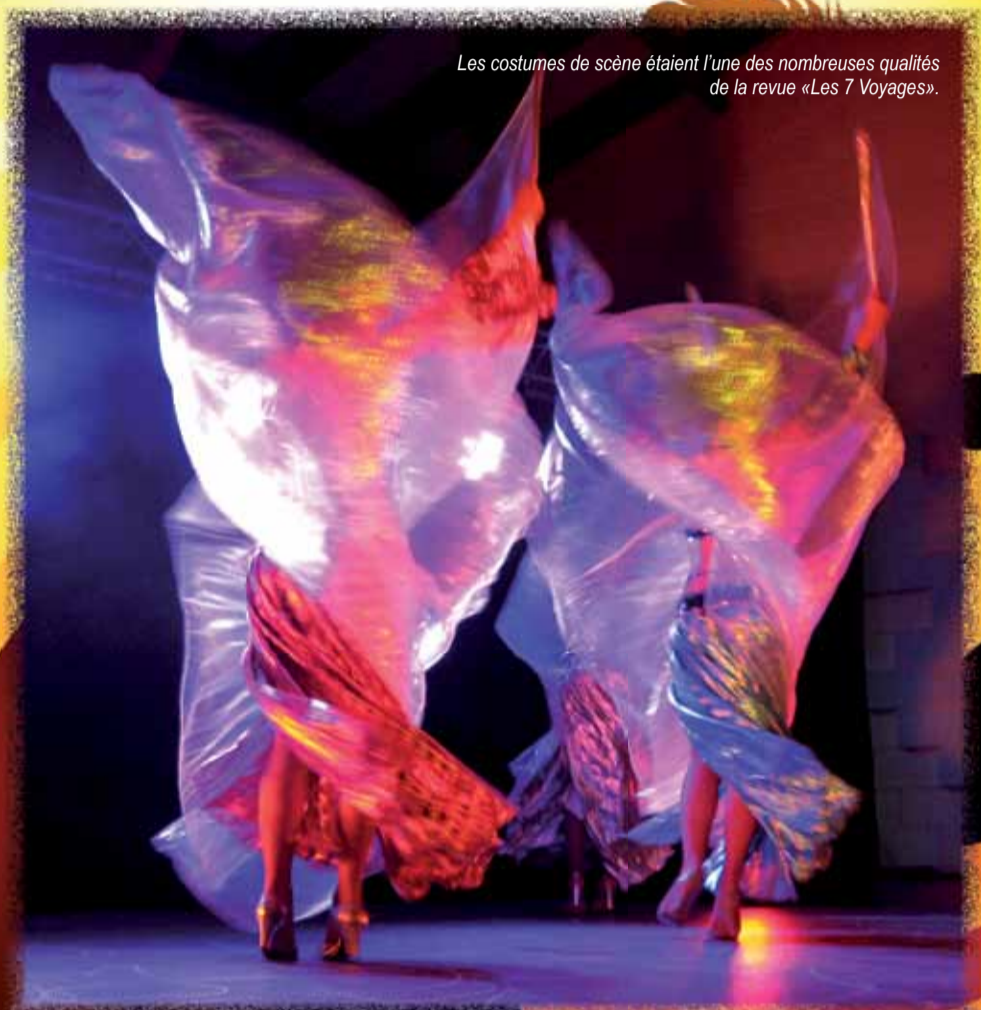
Les costumes de scène étaient l'une des nombreuses qualités de la revue «Les 7 Voyages».