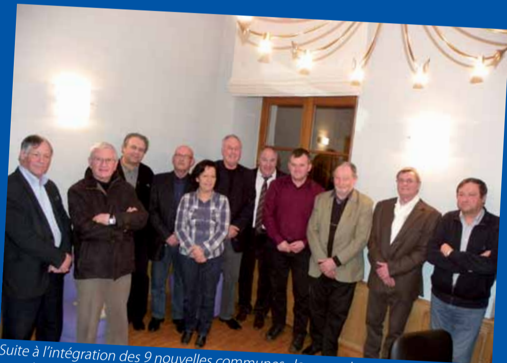
Suite à l'intégration des 9 nouvelles communes, le nouvel exécutif de la CCST au grand complet (Président et Vice-Présidents) au soir du premier Conseil Communautaire (7 mars 2013).