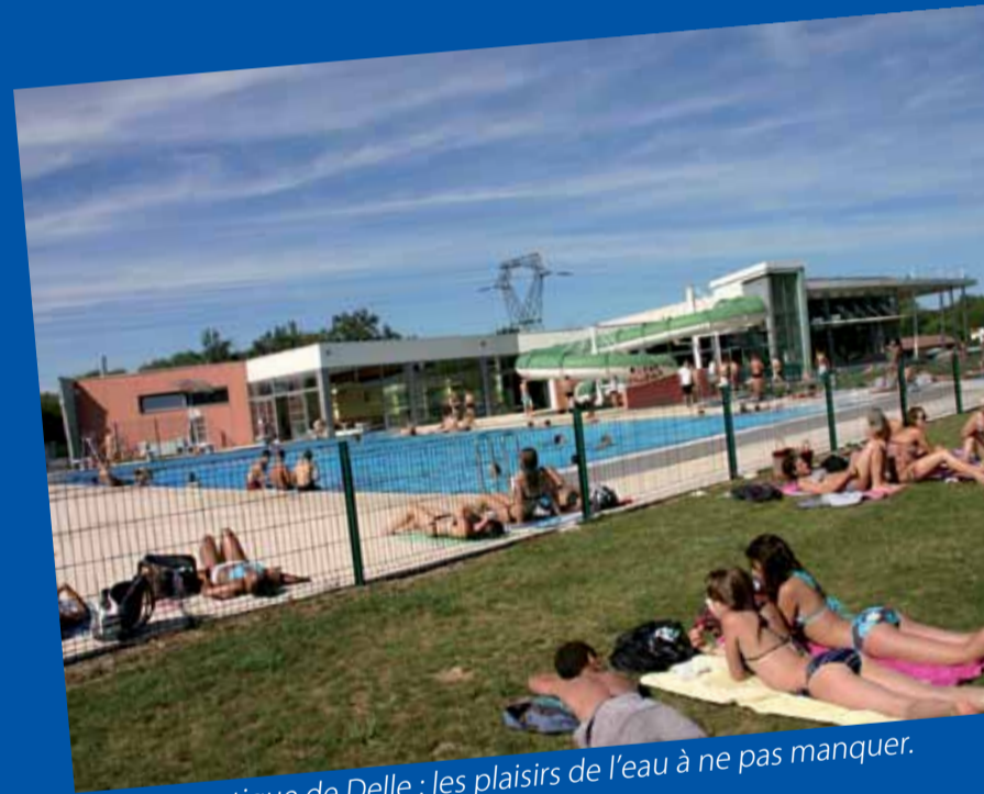
La base nautique de Delle : les plaisirs de l'eau à ne pas manquer.