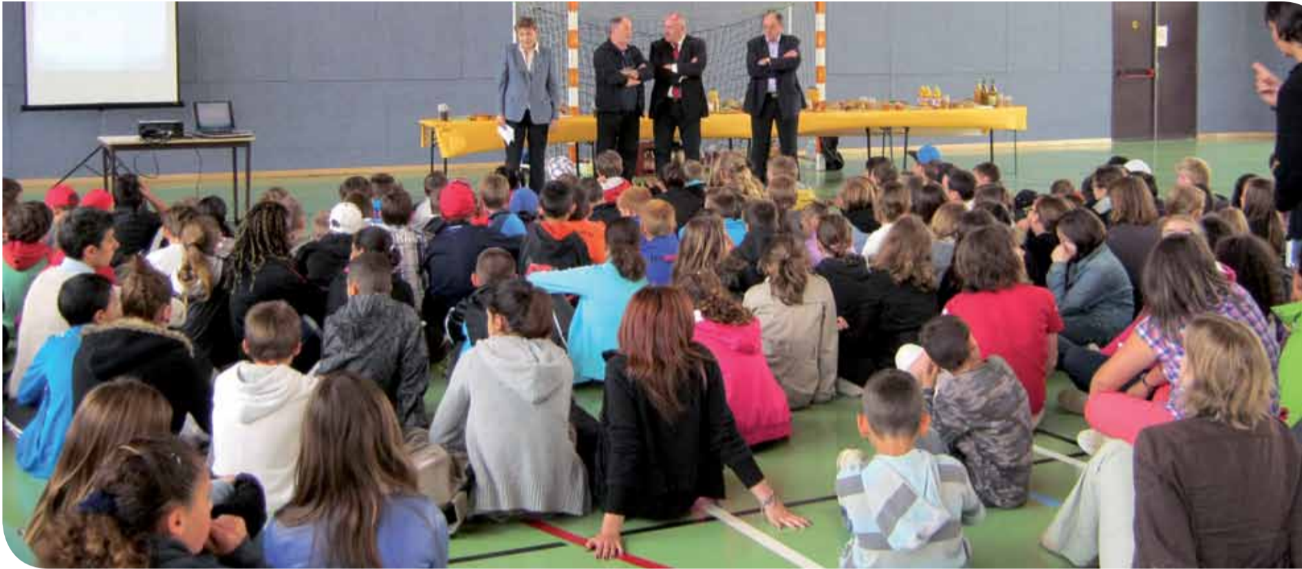
Contrat rivière : le 25 juin 2013, restitution officielle des classes rivière menées durant l'année scolaire 2012-2013

Signé le 18 juin 2010 (voir Écho du Sud printemps-été 2011), le Contrat de rivière Allaine est un programme d'action d'une durée de 5 ans animé par la Communauté de Communes du Sud Territoire en France et la République et Canton du Jura en Suisse. Il a pour but la préservation de l'eau, la restauration et l'entretien des milieux aquatiques afin d'atteindre le bon état demandé par la Directive Cadre Européenne sur l'Eau aux horizons 2015, 2021 et 2027.