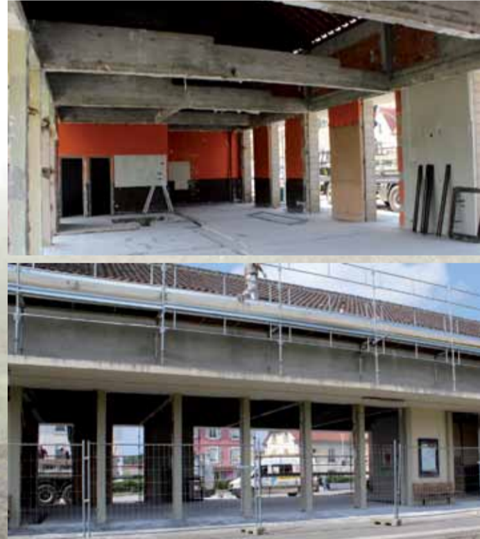
La gare de Delle en chantier jusqu'au mois d'octobre.

Le projet séduit les collectivités et les partenaires privés et des bonnes fées se penchent déjà sur le berceau de la nouvelle gare qui sera un exemple en terme d'innovation sociale et de développement économique.