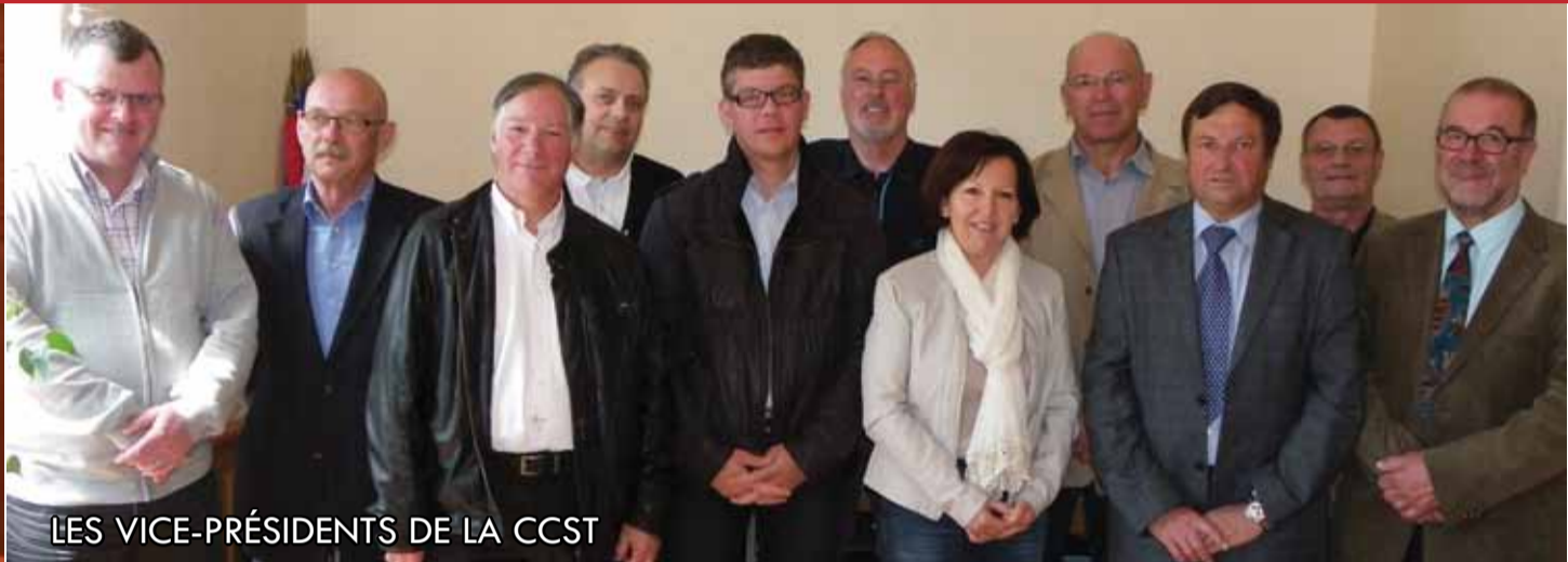
LES VICE-PRÉSIDENTS DE LA CCST