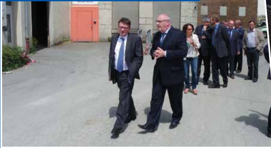
Le Préfet de notre département à la rencontre du Sud-Territoire.