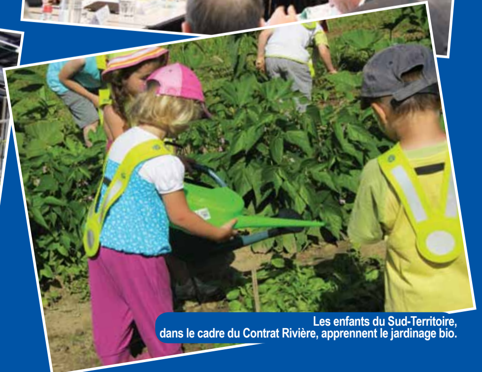
Les enfants du Sud-Territoire, dans le cadre du Contrat Rivière, apprennent le jardinage bio.