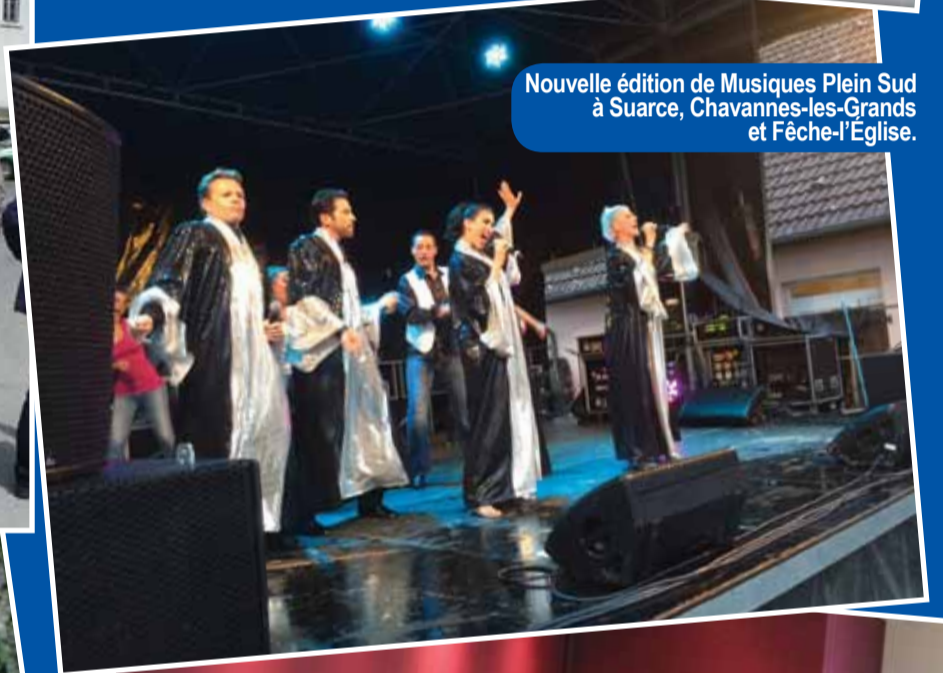
Nouvelle édition de Musiques Plein Sud à Suarce, Chavannes-les-Grands et Fêche-l'Église.