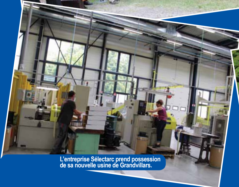
L'entreprise Sélectarc prend possession de sa nouvelle usine de Grandvillars.