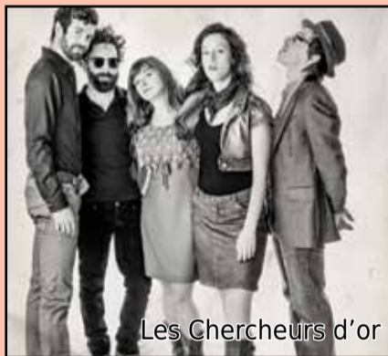
Les Chercheurs d'or